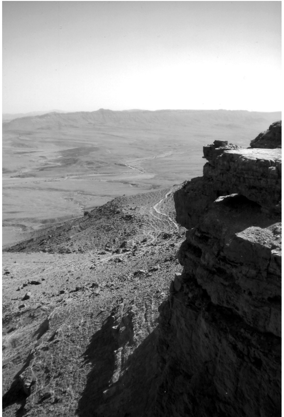
Negev-Wüste bei Beer Sheva