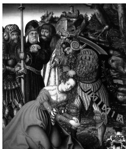
Martyrium der Hl. Barbara, Lukas Cranach d.Ä.

Am Barbara-Tag, dem 4. Dezember, ist es mancherorts noch Brauch, Kirschzweige ins Haus zu holen, über Nacht in warmes Wasser zu legen und dann in eine Vase zu stellen. Dann sollen sie an Weihnachten in Blüte stehen - ein schönes Symbol für die Geburt Jesu - Spross aus der Wurzel Jesse.