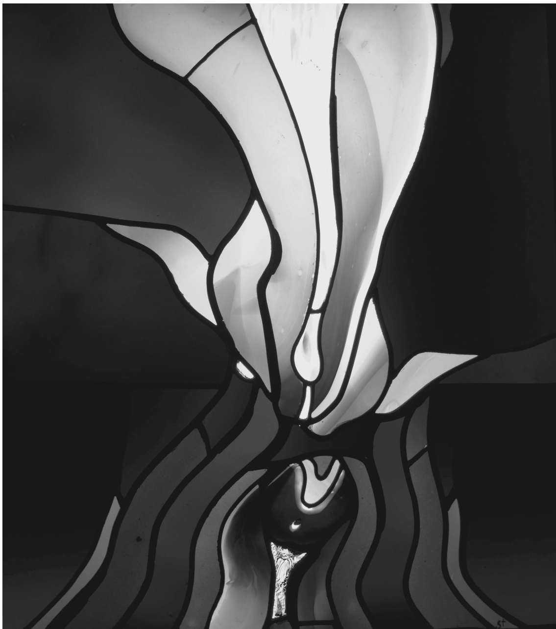
„Himmelserscheinung“, H. G. von Stockhausen

Er war in eine Wolke gehüllt, der Regenbogen über seinem Haupt und sein Antlitz war die Sonne.